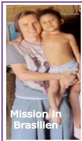
Mission in Brasilien